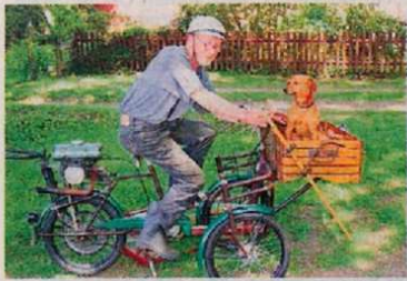
Herr und Hund auf drei Rädern.

Bei der Teufelsmoor-Rundfahrt der Fahrradhilfsmotorfreunde sind viele ungewöhnliche Konstruktionen zu sehen